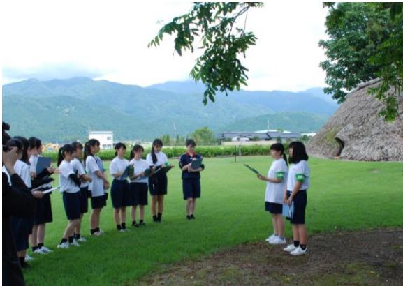
朝日町ガイド研修・不動堂遺跡 (R1.7月)