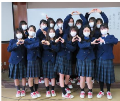
3月2日に卒業した3年生14名

・色々大変な時もあったけれど、培われた力もあったので頑張ってきて良かった。・最後には楽しい思い出になりました。・観ビに入ってつけた力を、社会に出てからも活かしていけるよう頑張りたいです。・ひとつひとつの活動が楽しく思い出に残りました。・普通科では体験できないことを経験する機会を与えてくださりありがとうございました。・フィールドワークで直接感じたことから色々学ぶことがたくさんありました。・母校がなくなると悲しいけど、今までありがとう。観ビの十四人は最高でした。