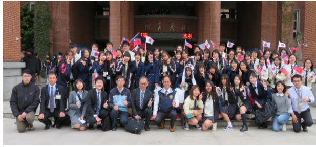
平鎮高級中等学校のみなさんと

・滑川の海岸線をたくさん歩いたこと、・宿泊研修が良かったこと、・滑川で富山湾岸クルージング船に乗って海から景色を眺めたこと、・あこやーの夜みんなで話したこと、・あこやーので花火をしたこと、・魚津の埋没林を見たこと